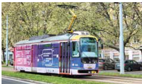
Nasedněte! Už jste jeli naší tramvají?