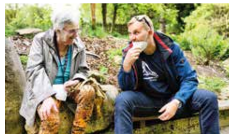
Dobrovolnický den Se seniory v zooparku