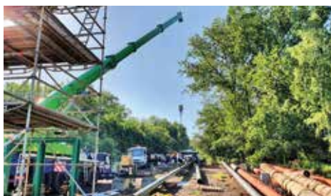
Letní odstávky 2021 Přehledné mapy