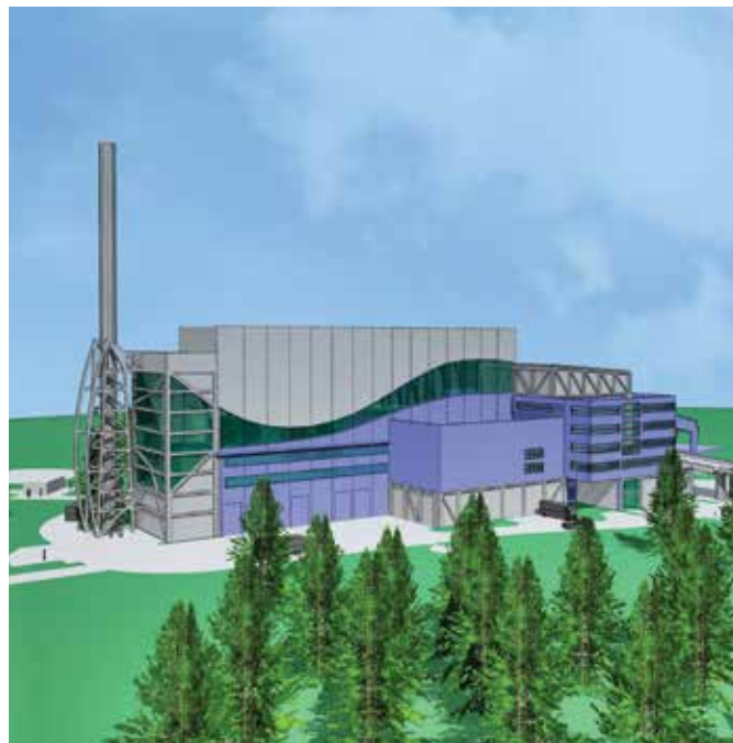
Vizualizace plánované spalovny v Komořanech.