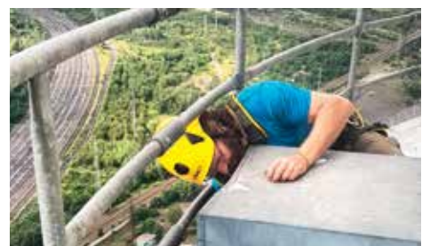
Sokolí hnízdo je připraveno na nové nájemníky