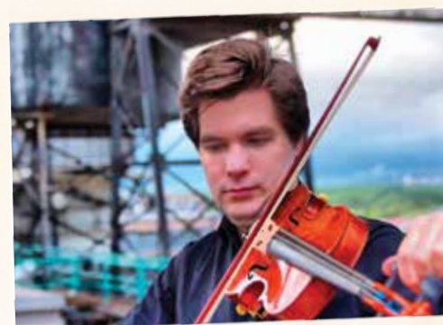
Milan AI ASHHAB – houslista