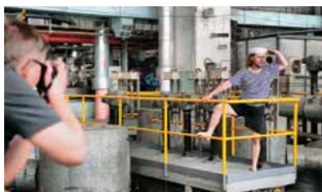
Tváře Mostecká Netradiční focení v teplárně