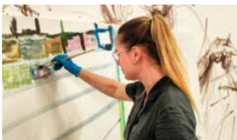
Týden tvorby v uvolněné atmosféře